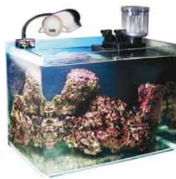
5 - 10 kg live rocks