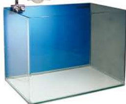
40 - 200 l Aquarium