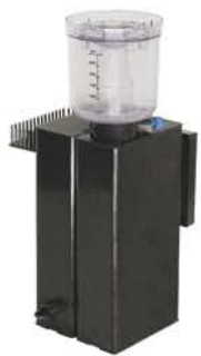
Nano Reefpack 200